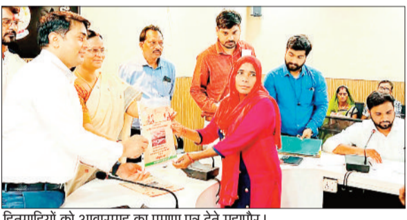
हितग्राहियों को आवासगृह का प्रमाण पत्र देते महापौर।

हरिभूमि न्यूज >> कोरबा प्रधानमंत्री आवास योजना (शहरी) 2.0 के तहत मोर जमीन-मोर मकान बीएलसी घटक अंतर्गत नगर निगम क्षेत्रांतर्गत वर्तमान में 722 नए हितग्राहियों को आवासगृहों की स्वीकृति प्राप्त हो चुकी है। नगर निगम सभा कक्ष में महापौर श्रीमती संजुदेवी राजपूत ने निगम आयुक्त आशुतोष पाण्डेय की उपस्थिति में 33 हितग्राहियों को आवासगृहों के स्वीकृति पत्र व भवन निर्माण अनुज्ञा पत्र प्रदान किया।