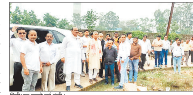
निरीक्षण करते पूर्व मंत्री।

पिछले चार दिनों से जिले में लगातार बारिश की वजह से निचली बस्तियों में पानी भर गया था। खासतौर पर बालको के शांतिनगर, रिंगरोड, टैंगुरनाला, कुलिंग टॉवर बस्ती की हालत बंद से दत्तर थी। जैसे ही इसकी सूचना प्रदेश के पूर्व राजस्व मंत्री को मिली वे दल बल सहित बस्तियों में पहुंचे और आमजनता से मुलाकात कर जलमय क्षेत्र को तत्काल खाली कराने के लिए अधिकारियों को निर्देशित किया।