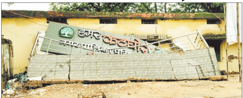
बारिश में क्षतिग्रस्त दीवार के नीचे दबा बोर्ड।