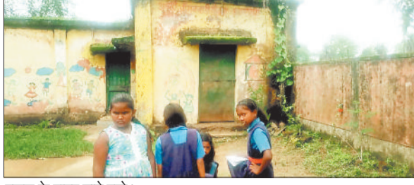
स्कूल के बाहर खड़े बच्चे।