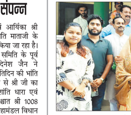
कटघोरा। राष्ट्रीय उपाध्यक्ष सरोज पाण्डेय 8 जुलाई को रायपुर से मेलापट जते समय कुछ वक्त के लिए कटघोरा के पीडब्ल्यूई रेस्ट हाउस में रुकीं जहां पर भारतीय जनता पार्टी के जिलाध्यक्ष गोपाल मोदी के नेतृत्व में भाजपा के कार्यकर्ताओं के द्वारा सरोज पाण्डेय का स्वागत किया गया।