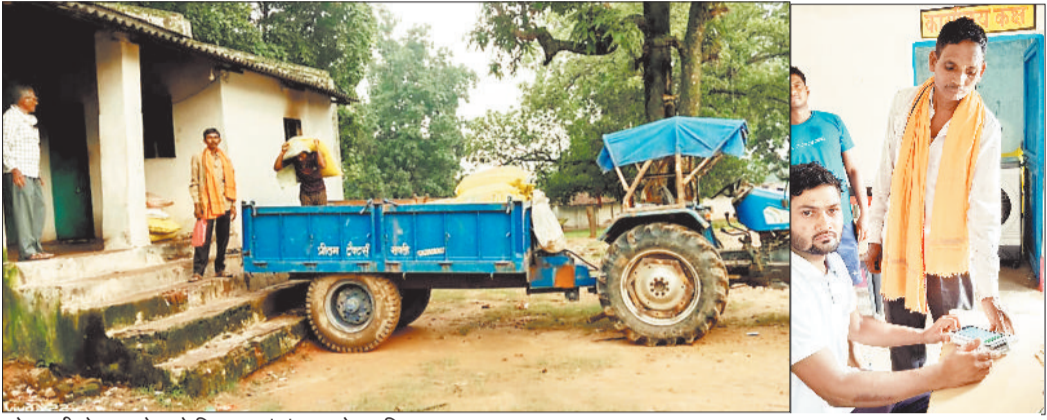
सोसायटी से खाद ले जाते किसान एवं थंब लगाते हुए किसान।

हरिभूमि न्यूज >> कोरबा रासायनिक खाद की काला बाजारी रोकने के लिए अब किसानों के स्वयं उपस्थित होकर थंब लगाने पर ही खाद